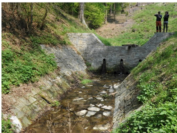
přehrážka na Křivoklátsku